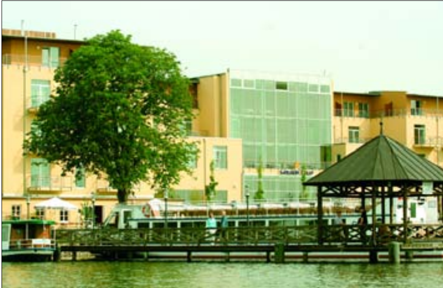
Das neue Seehotel Fontane in Neuruppin sorgt für Impulse für die Entwicklung der Urlaubsregion Ruppiner Land.