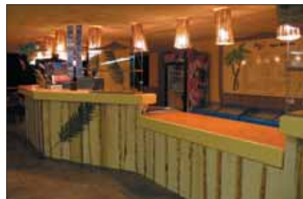
Junge Mitarbeiter sorgten für frisches Design - hier alt und neu (rechts).